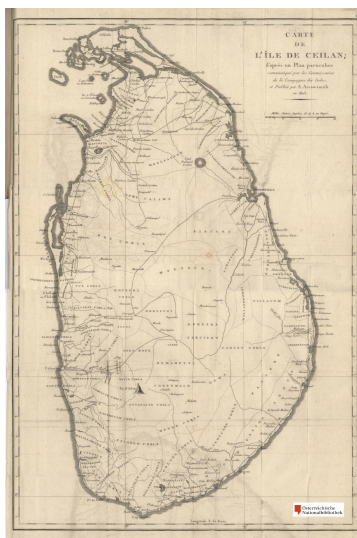
Carte de l'île de Ceilan