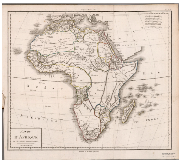
Carte d'Afrique - pl.15