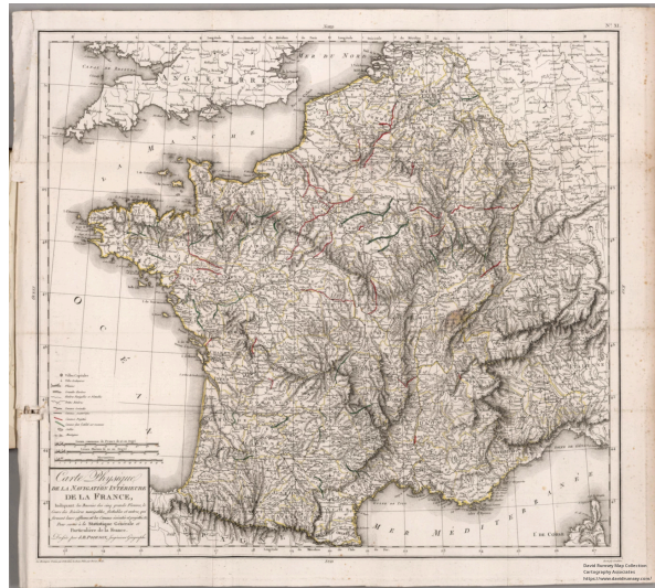
Carte physique de la navigation intérieure de la France- pl . 11