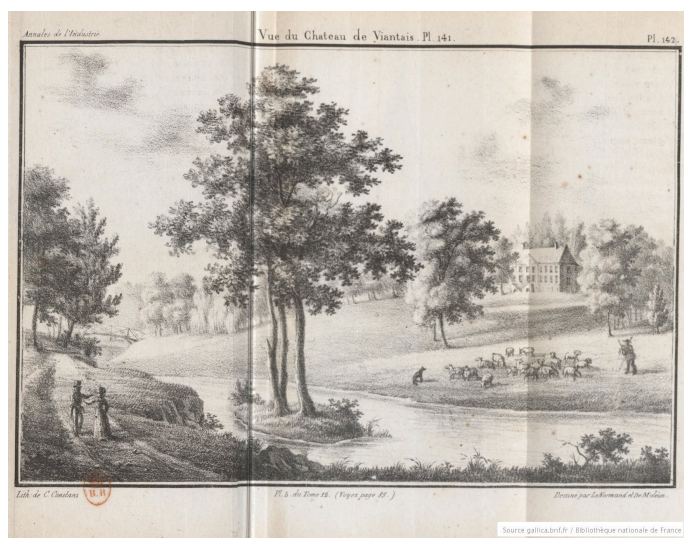
Vue du chateau de Viantais (planche 141-142)