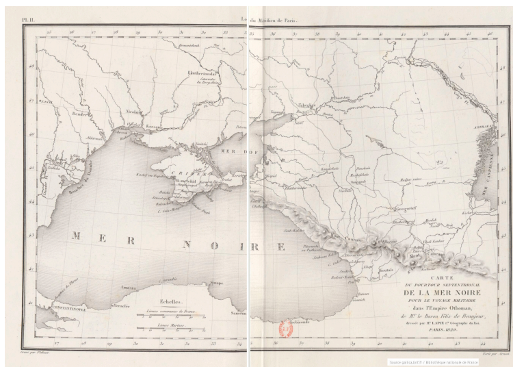
Carte du pourtour septentrional de la mer Noire