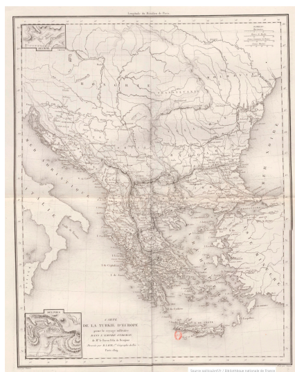
Carte de la Turquie d'Europe