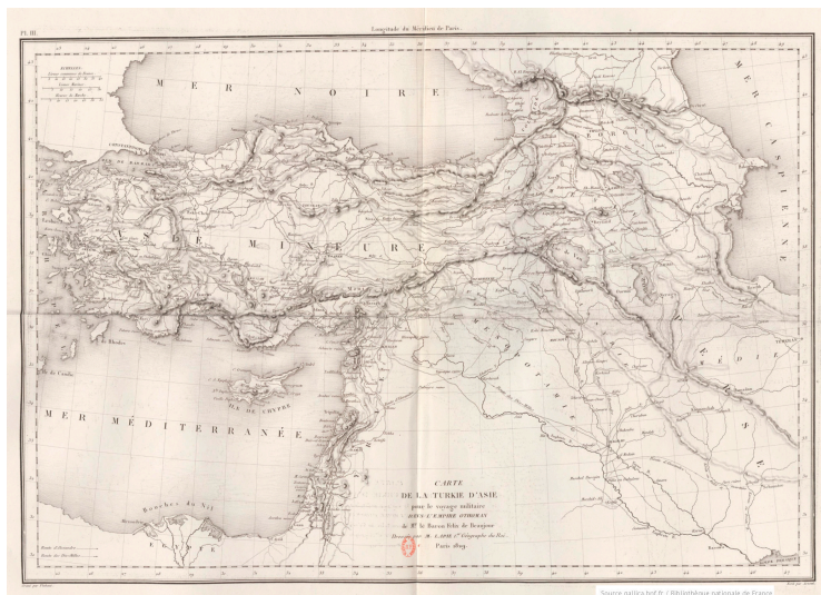
Carte de la Turquie d'Asie