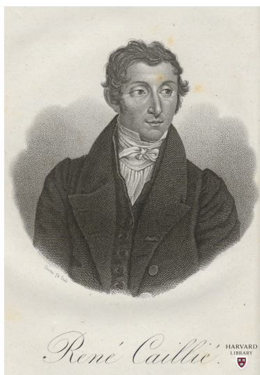
Portrait de René Caillié