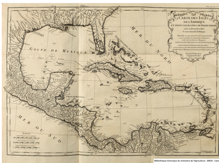
Carte des isles de l'Amerique et de plusieurs pays de terre ferme situés au devant de ces isles & autour du Golfe de Mexique