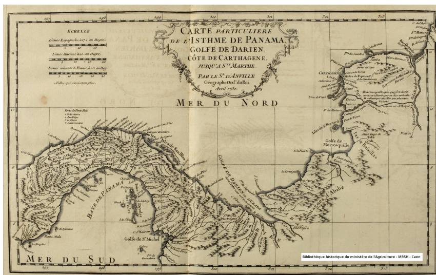
Carte particulière de l'Isthme de Panama