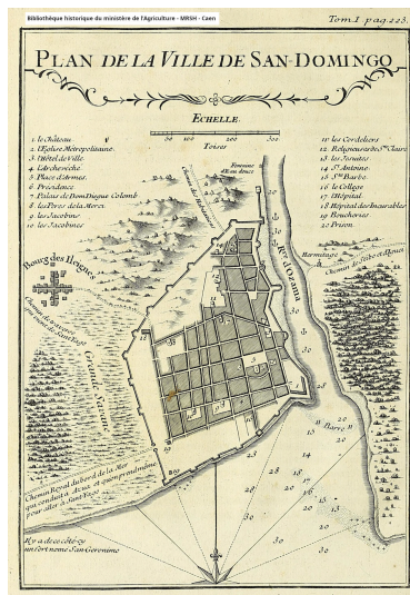
Plan de la ville de San Domingo