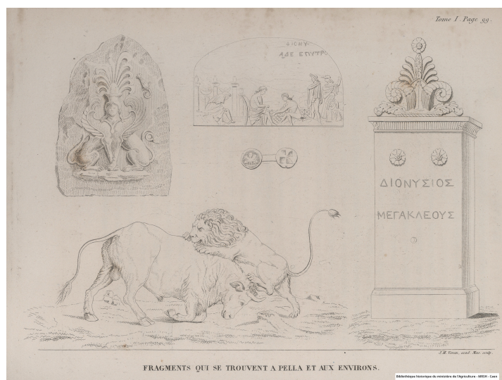
Fragments qui se trouvent à Pella et aux environs (t.I, p.98)