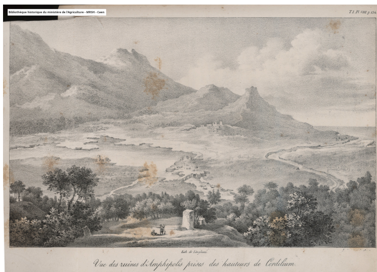
Vue des ruines d'Amphipolis prises des hauteurs de Cerdilium (t.I, p.134)