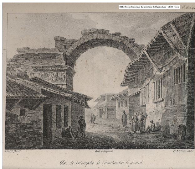
Arc de triomphe de Constantin (t.I, p.28)