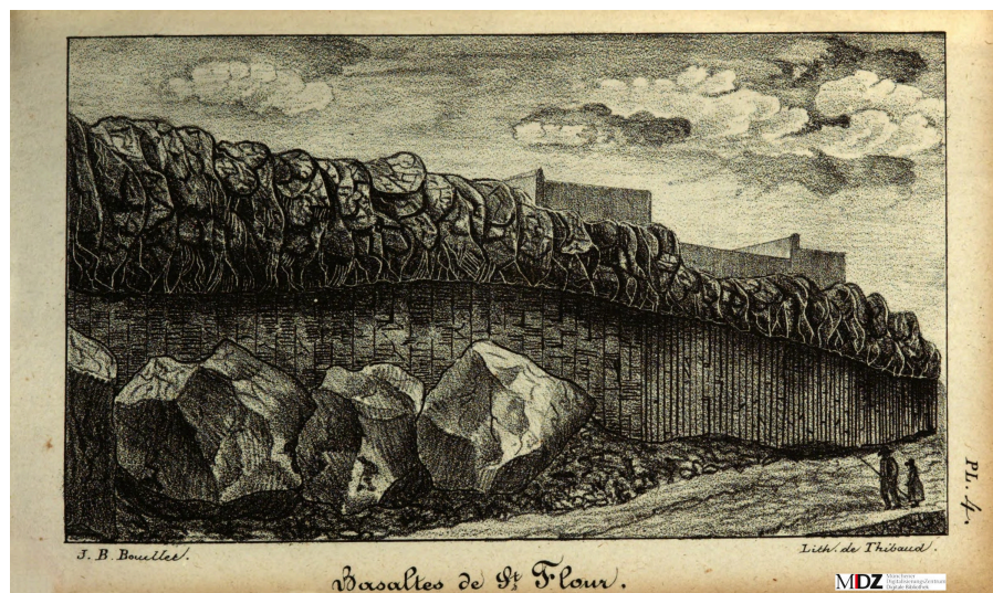
Planche 4 - Basaltes de Saint-Flour.