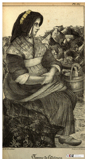
Planche 34 - Femme de l'Artense