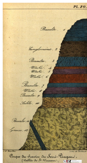
Planche 29 - Coupe du ravin du Serri-Piagat (vallée de Saint-Vincent)