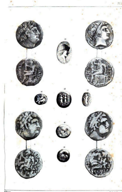
Médailles et Pierres gravées Dessiné par M. de la Harpe