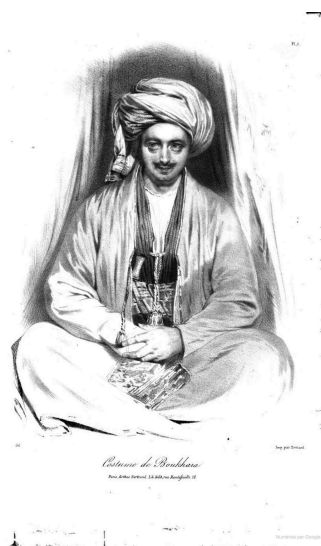
Planche 1. Costume de Boukhara