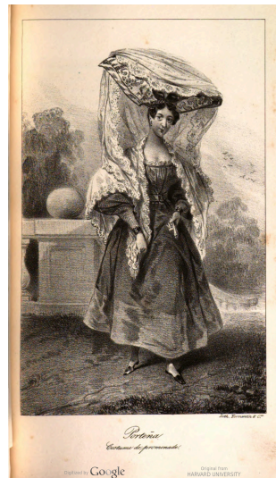
Portena, costume de promenade