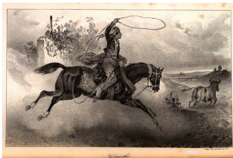
Gaicho, enlaçant un boeuf