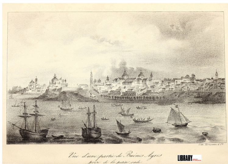
Vue d'une partie de Buéno-Ayres