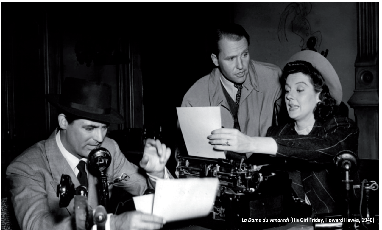
La Dame du vendredi (His Girl Friday, Howard Hawks, 1940)

Partant de ce constat, l'Afeccav propose de se pencher, à l'occasion de son 13 e congrès, sur les liens multiples et complexes tissés entre l'écrit et les écrans, dans les processus de création mais aussi de réception ainsi que dans les œuvres, et en considérant tant les productions écrites proprement dites que les modalités d'écriture.